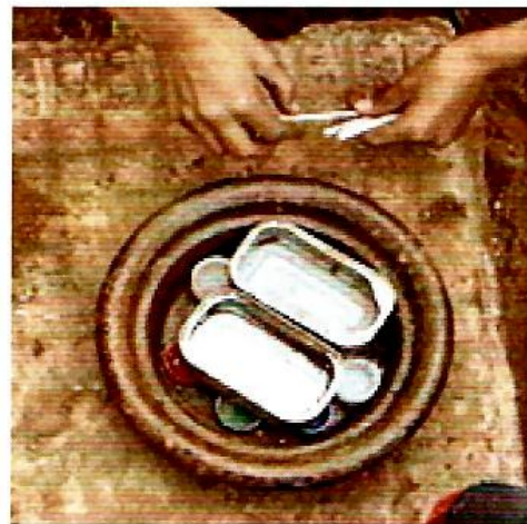
Foto 7 - Il pasto dei camionisti, Sidi Ifni, 2006

Un altro ragazzo di otto anni, che si chiama Miloud, è