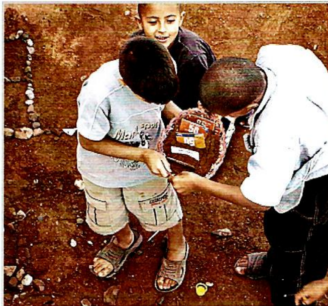
Foto 5 - Ragazzi che portano alla pasticceria il dolce di compleanno, Sidi Ifni, 2006

cercare un carico di sabbia. Quando la sabbia è scaricata, viene a mangiare la sua pietanza alla quale Lahoucine ha aggiunto due grandi pesci arrosto, delle scatole di sardine vuote messe su pezzi di "kefta", pezzi di carne rappresentati da tappi di bottiglia (foto 7).