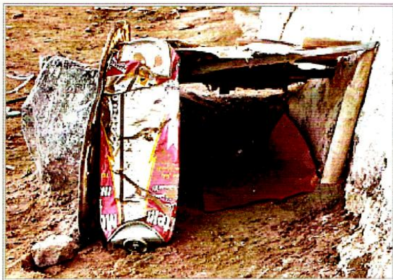
Foto 2 - Casetta fatta con materiali di recupero, Sidi Ifni, 2006, foto Khalija Jariaa

Nel pomeriggio il gruppo dei bambini si è allargato e si sono aggiunte alcune bambine. Un gruppo di ragazzi ha delimitato lo spazio per una grande casa ( foto 3 ), con una recinzione fatta con una corda alla quale appendono dei pannelli pubblicitari, delle bandiere e dei pezzi di cartone. La ragazza seduta voleva integrarsi con i loro giochi, ma in un primo momento non è stata ammessa. Tuttavia, può partecipare al gioco quando essa propone di pulire la casa. Nel frattempo i ragazzi iniziano a discutere della