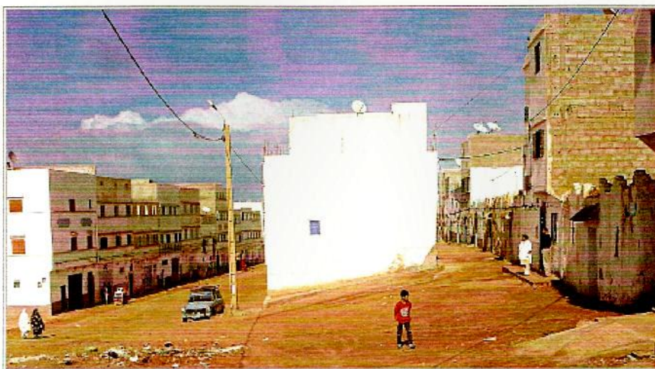
Foto 1 - Veduta di un terreno di gioco del quartiere Boulalem, Sidi Ifni, 2007, foto dell'Autore.

recinendo un terreno fabbricabile, sulla sinistra della foto. Uno dei ragazzi minaccia con il suo fucile di "roseau" 3) , colui che s'è introdotto nel suo terreno e gli dice: "Che cosa fai?". Quest'ultimo risponde: "Prendo solo un po' di terra per costruire la mia casa".