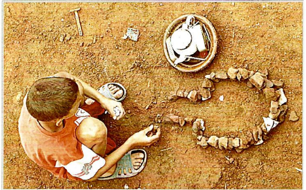
Foto 8 - Costruzione del ristorante in miniatura e della via di accesso, Sidi Ifni, 2006